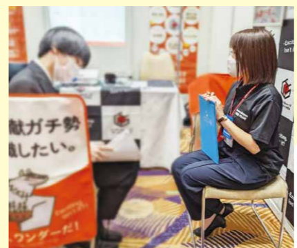
就活生にも寄り添いを大切に對話する人財開発課

新卒者だけに限らず、年齢・経験関係なく「やってみよう」という声に対し多くのチャンスがあるワンダーストレージホールディングスだからこそ、若い人材は継続的に募集を行っていきたく思います。ワンダーストレージホールディングスの基盤である介護を知って頂き、そこで学んだり、発想したことが会社全体の肥やしになり、社会を変えるエネルギーになります。