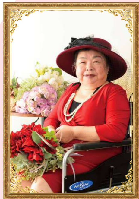
大好きなワインレッド色のドレス。ジャージ素材なので伸縮性が高く、車椅子でも着ていて苦しくありません。