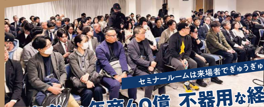
セミナールームは来場者でぎゅうぎゅう!