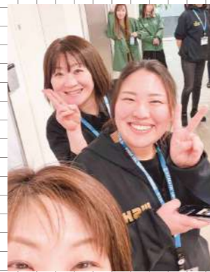
みんなで頑張りました!