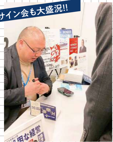
サイン会も大盛況!!