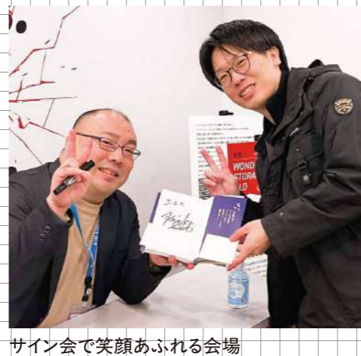
サイン会で笑顔あふれる会場