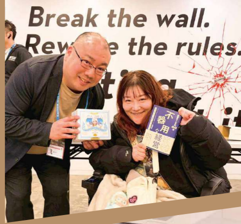
社員はエントランスでの聴講となりました