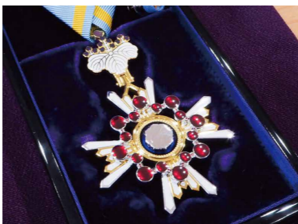
天皇陛下よりいただいた瑞宝双光章